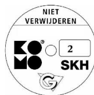
geschikt voor weerstandsklasse 2